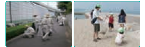
事業所周辺を清掃(バライト大阪)